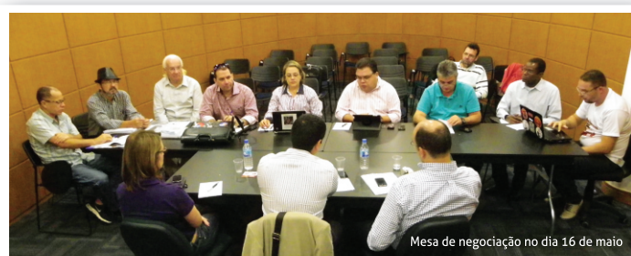
Mesa de negociação no dia 16 de maio

Nossa pauta contém cláusulas importantes, algumas com nenhum impacto financeiro, porém a empresa sequer as avaliou. Na verdade, sabemos que a Datamec tem condições de nos atender, pois, apesar de todos os desmandos da diretoria, fizemos nosso papel e garantimos resultados e a estabilidade financeira da empresa. Fizemos nossa parte e agora esperamos que a