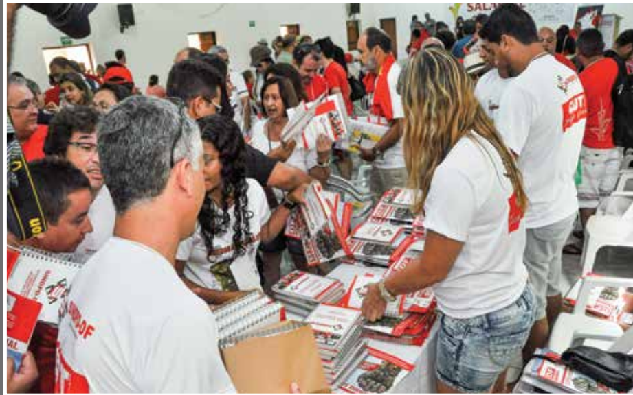
SINDPD-DF entregou agendas e calendários para os participantes da Plenária

Outra conquista do Distrito Federal foi a escolha da identidade visual da Campanha Salarial 2014/2015. A arte, criada pela agência Repense, assessoria de comunicação do SINDPD-DF, foi eleita para representar nacionalmente a luta dos trabalhadores. O punho cerrado é um gesto conhecido da luta dos trabalhadores, símbolo de união, resistência e engajamento, atitudes que todos os trabalhadores terão que ter na campanha deste ano.